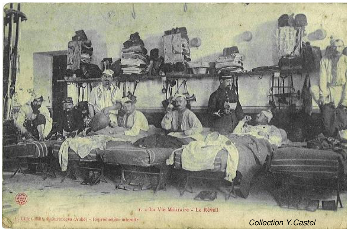
1. - La Vie Militaire - Le Réveil