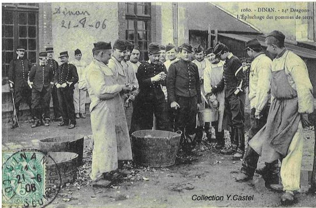
Epluchages des pommes de terre, 24 ème Dragons (1906)