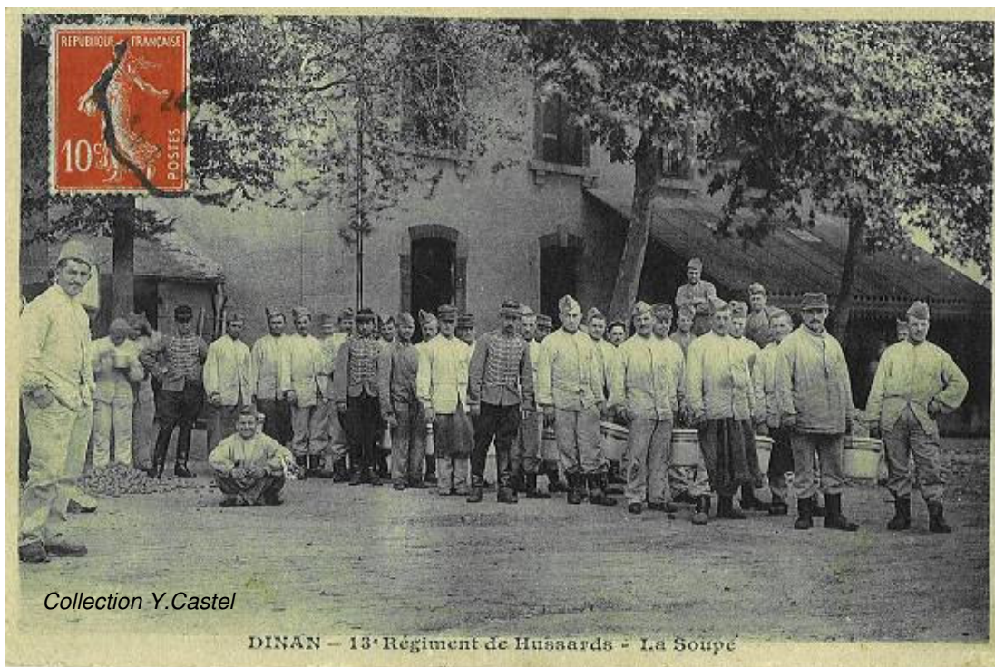
Après les patates, la soupe. 13 ème Hussards